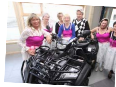
ATV 550 cc Verdi 80.000,-