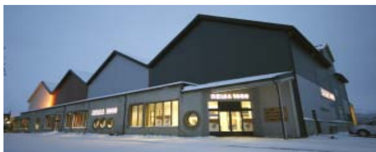
Dette bygget skal romme 24 leiligheter i 2. og 3. etasje.

Leilighetene får Salangens mest maritime utsikt. – Enkelte leiligheter får balkonger på 40-50 kvadratmeter så og si rett på sjøen, så her blir det like naturlig med båt som med bil utenfor stuedøra, sier en optimistisk Lynum.