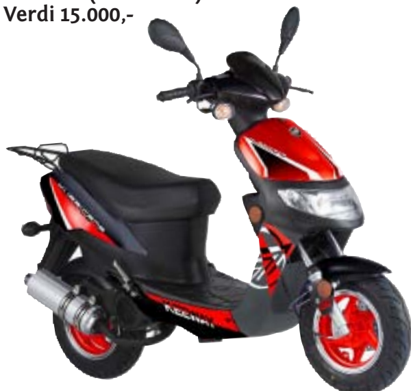
MOPED (SCOOTER) Verdi 15.000,-