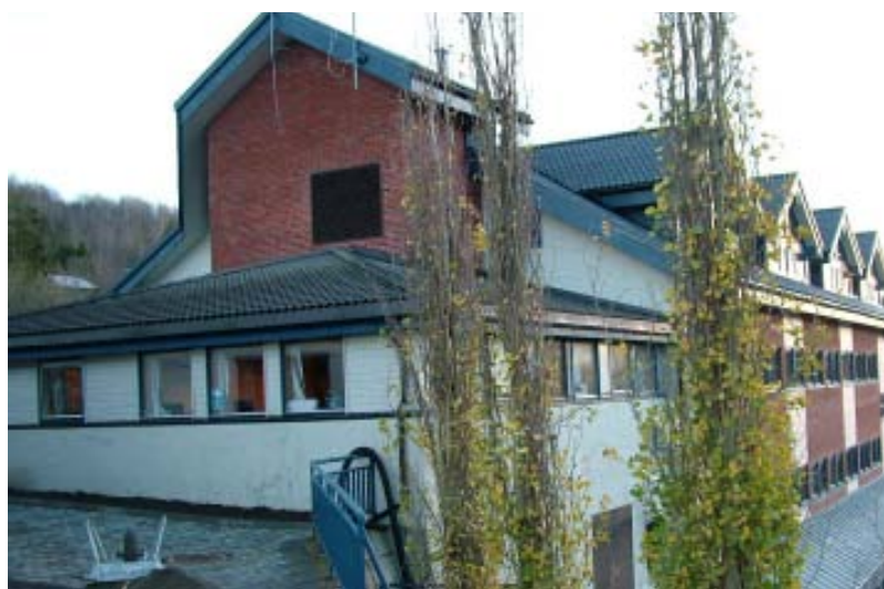
Sjøvegan videregående skole ble startet i 1971, og har i dag ca 300 elever.

Sjøvegan videregående skole har mange venner, og alle har bidratt i arbeidet med å sikre skolens framtid. – Jeg har stor tro på at mange også kommer til å ta del i jobben for å sikre et bredt og godt tilbud ved skolen. – Da kan vi sammen sørge for at skolen utvikles videre, sier han.