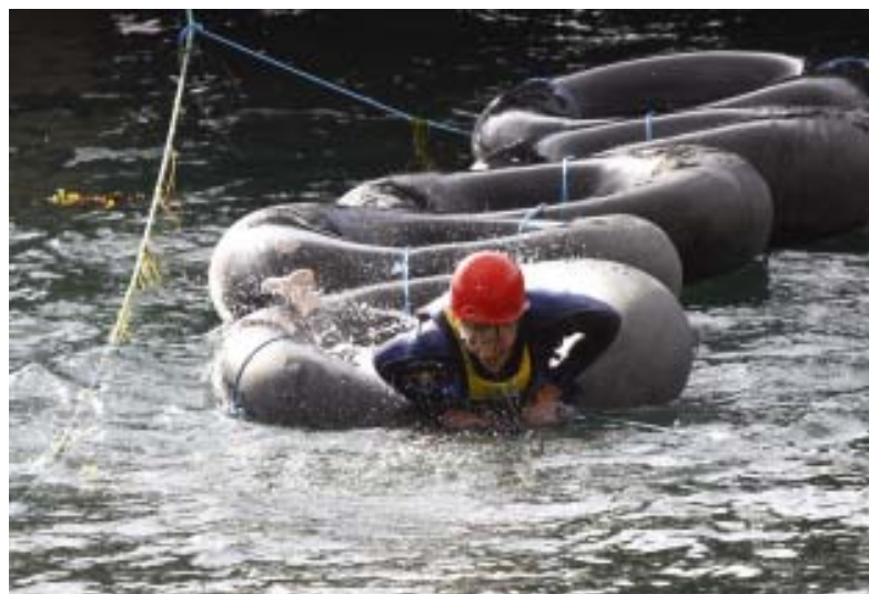
Det er krevende å komme seg over alle hindrene under "Ta sjansen".

Hvem som har det beste treningsgrunnlaget i år, vil vise seg fredag 2. juli. 4 vinnere får hvert sitt reisegavekort i premie.