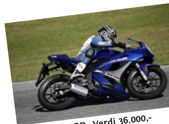
SPEED MOPED. Verdi 36.000,-

Går til den som fanger den største (tyngste) fisken alle dager, uansett art.