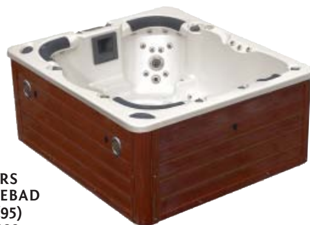
UTENDØRS MASSASJEBAD (215X190X95) Verdi 99.000,-