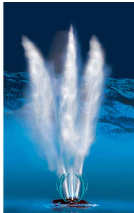
Slik tenker kunstneren at havfontenen blir seende ut.

Bruvold har bare fått positive tilbakemeldinger etter at de lanserte den sprudlende ideen. – Det