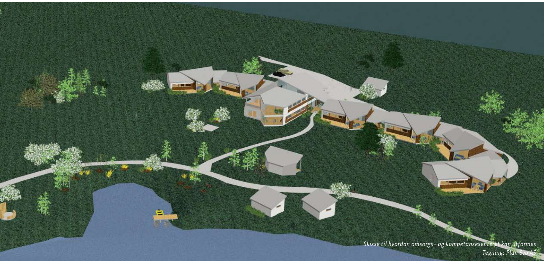
Skisse til hvordan omsorgs- og kompetansesenteret kan utformes Tegning: Plan Eva AS