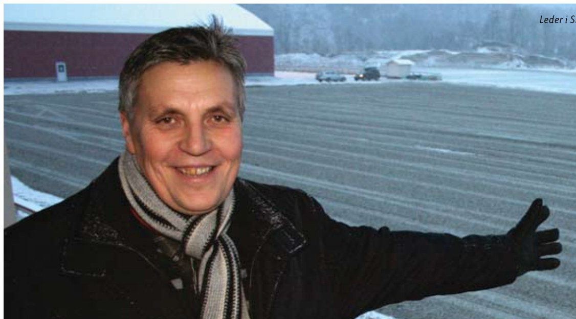
Leder i SIF-fotball kan neste år åpne ny kunstgressbane på Idrettsheia. Da har klubben investert over 11 millioner kroner i nye anlegg