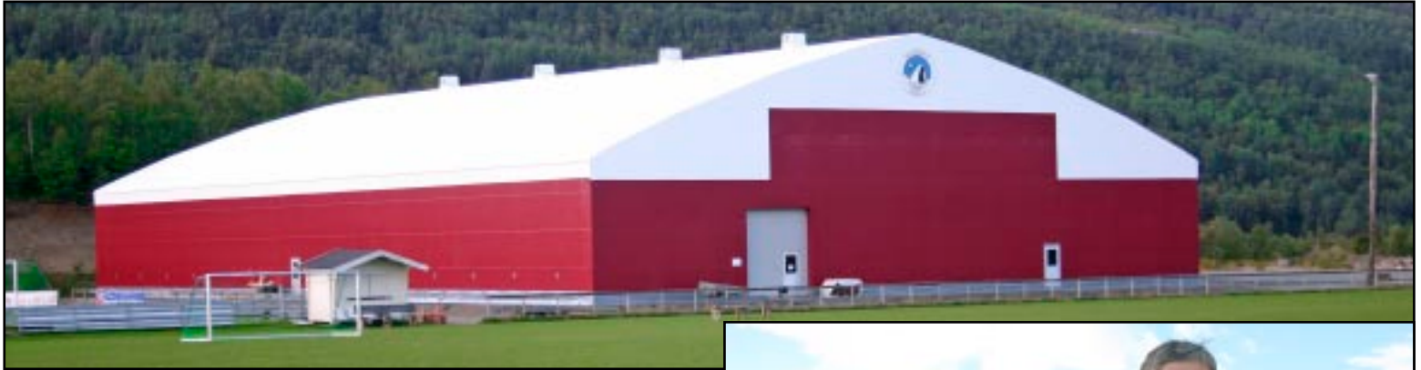
ASTAFJORDHALLEN: Ny storstue for idretten i Salangen.

Rød og hvit som ei gedigen halvmoden tyttebær lyser Astafjordhallen mot deg når du runder svingen inn mot Idrettsheia. Dette er det mest moderne innen plashaller som er å oppdrive på markedet, og en hall som representerer framtida for mange idrettsgrener.