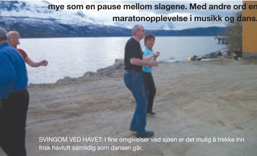
SVINGOM VED HAVET: I fine omgivelser ved sjøen er det mulig å trekke inn frisk havluft samtidig som dansen går.

Dansegalla og svingom blir det store trekkplasteret under årets sommer arrangement i Salangen. Rikingan og Amadeus skal sørge for liv og røre i et 300 kvadratmeter stort telt som settes opp på Lundplanet. I seks strake timer skal de to bandene spille til dans, uten så mye som en pause mellom slagene. Med andre ord en maratonopplevelse i musikk og dans.