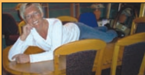
Like blid og hyggelig som alltid En møbelhandler fra Lavangen trives fortsatt på Sjøvegan.

En fantastisk vår har gitt oss en ekstra følelse av sommer. Vi håper på godt vær for alt som skal skje i Salangen denne sommeren. Side 3, 8, 9, 12 og 16