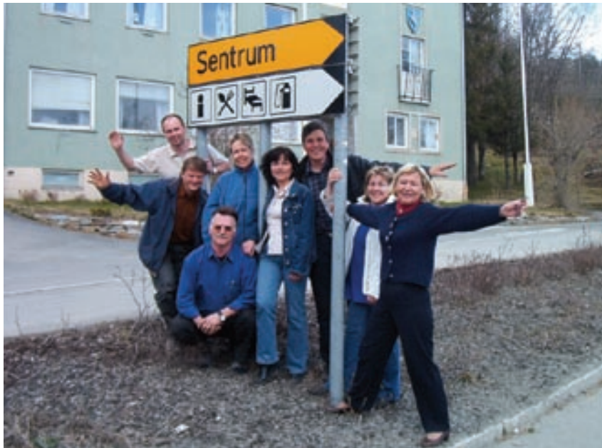
SALANGEN I SENTRUM: Komiteen bak årets Sommer i Salangen.

Sommer i Salangen er blitt en kjær tradisjon for innbyggerne i kommunen og folk i nabokommunene. Her treffes gamle kjente og utflytta salangsværinger har mye å glede seg til dersom ferien legges til hjemtraktene i månedskifte juni/juli.