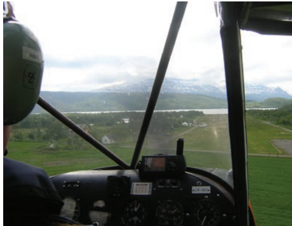
ELVENES LEIR: Flystripen på Elvenes kan bli et senter for luftsport.

-Til høsten skal Skifte Eiendom ha klar en takst, og da bør kommunen være i stand til å gå inn som en av eierne, sier Prestbakkmo.